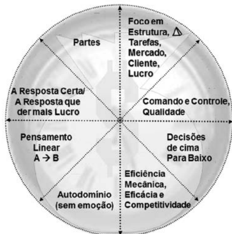
Figura 1. Visão mecanicista-mercadológica de mundo

Elaborada a partir de ideias apresentadas por Silva, Peláez, Romero (2001) 11 e de Ellinor, Gerard (1998) 34 .